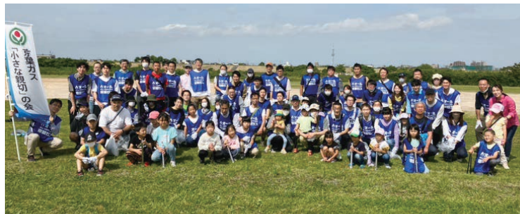
江戸川クリーン作戦

献血やチャリティー募金の実施、大災害の発生に際しては、運動本部の見舞金、義援金の呼びかけにいち早く応じて寄付を行う等、被災地支援にも積極的に取り組んでいます。