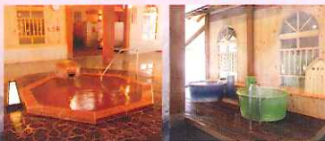
四季の湯 (季節風呂) 母子の湯 (女性内湯のみ)

当館最大級のお風呂 大滝の湯 大きな岩と流れる滝の景色が美しい、 当館最大のお風呂です。