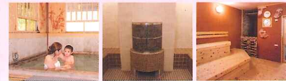
親子風呂 スチームサウナ 岩塩黄土サウナ