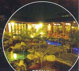
夜景がキレイ 五色の湯