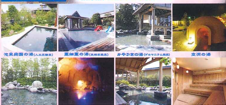
池泉庭園の湯 (人工温泉) 藍細葉の湯 (天然岩風呂) かやぶきの湯 (アルマニウム風呂) 空洞の湯 竹林の湯 青の洞窟 (洞窟風呂) 明鏡止水の湯 乾乾の洞 (洞窟)