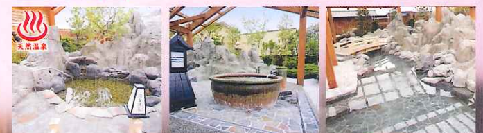
海香温泉 (天然温泉) 釜の湯 吉祥の湯 (アルマニウム風呂)