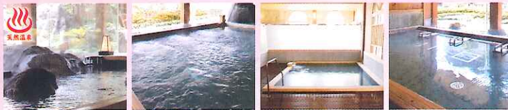
海香温泉 (天然温泉) 旋泡の湯 (ジャグジー) 願引の湯 (湯舟) 仰臥の湯 (浴槽)